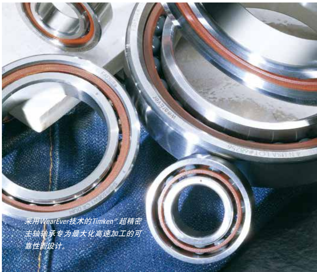
采用WearEver技术的Timken®超精密 主轴轴承专为最大化高速加工的可靠性而设计。

使用铁姆肯公司用WearEver材料制成的超精密主轴轴承能够加工更好的表面精度, 有助于减少二次表面加工和所需的检验工作。