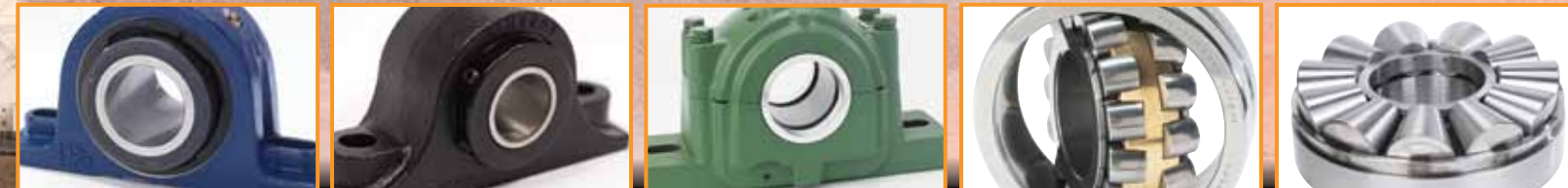
带座调心滚子轴承单元