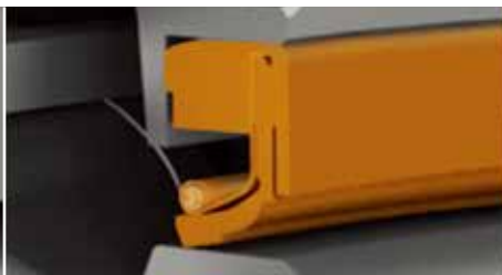
Timken® PTFE 风能密封