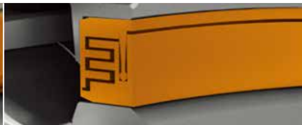
Timken® EcoTurn 迷宫式风能密封