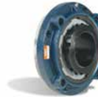
引导法兰圆柱式带座轴承